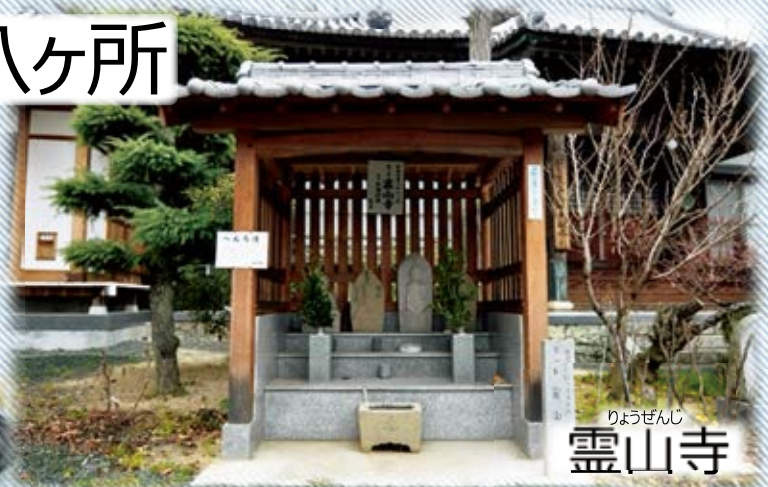
りょうぜんじ 霊山寺

島四国八十八ヶ所の縁日は、 毎年4月20日・21日です。 その昔、島から出て本四国に巡拝するのは 困難であったため、島に八十八ヶ所を設けて お参りできるようにしたことから始まります。 島四国八十八ヶ所を歩いたお遍路さんは、 四国八十八ヶ所を歩いたのと同じご利益が あると伝えられています。