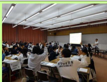
日頃の練習の成果を存分に発揮しました！

iProject! (担当教員：経済学部教授 松本直樹)では、10月21日(金)伊予市のウェルピア伊予にて企画発表会が開かれました。この発表会は、今年初めて企画されたもので、大学生が企業の方・伊予農業高等学校生の前で商品化したいレシピのプレゼンを行いました。今年度はびわアイス班・伊予市まるごとふりかけ班・そら豆カレー班・そら豆3色パウンドケーキ班・そらめちぎりパン班・みかんベーグル班・みかんレアチーズケーキ班がプレゼンを行いました。プレゼンでは、単にレシピを紹介するだけでなく、伊予市の現状をふまえて商品を紹介する班や、伊予農業高校生の「想い」に目を向けて説明する班など、商品化していただけるよう伝え方を工夫している班も見られました。プレゼン後は伊予農業高校生と交流する時間も設けられ、仲を深めることができました。