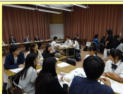
伊予農業高校生とも仲良くなりました♪