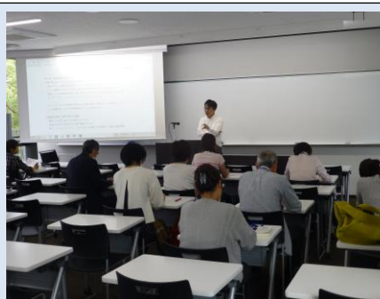
本学ならではの経済学部系講座も人気！