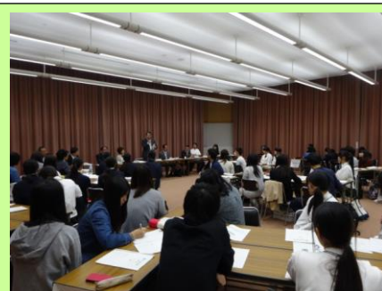
企業の方の厳しいご意見は参考になりました！