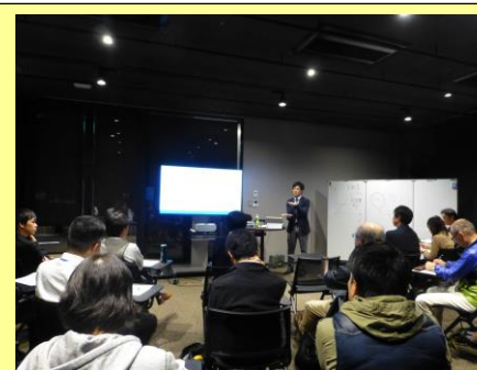
夜間の講座も多くのビジネスマンが受講。