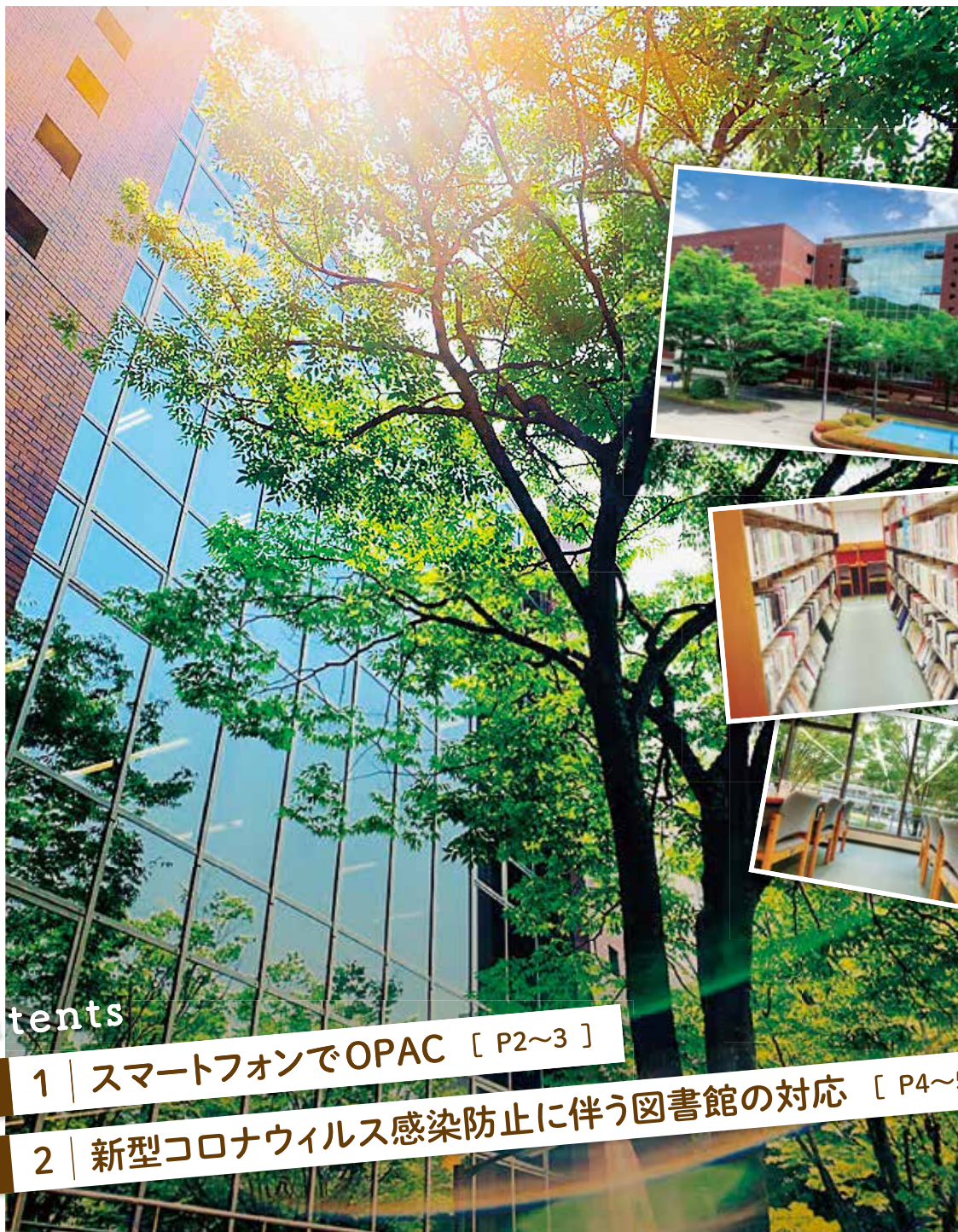
松山大学図書館 正面