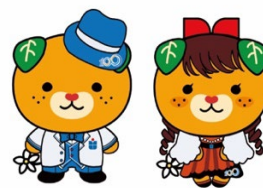
100周年松大みきゃん