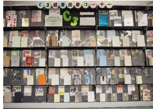
C3 選書図書コーナー