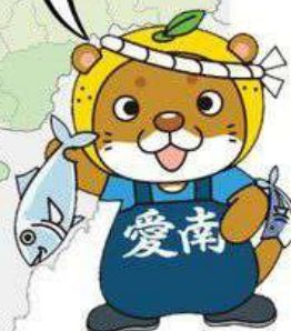
愛南町公式キャラクター 「なーしくん」